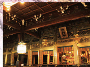
●西本願寺阿弥陀堂