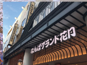
○なんばグランド花月