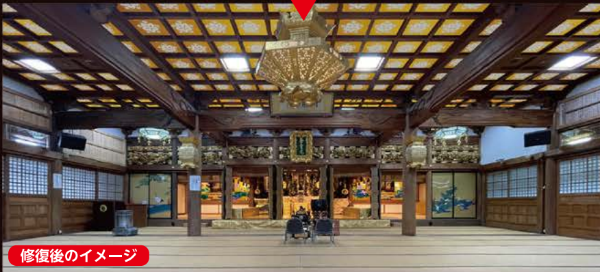
修復後のイメージ