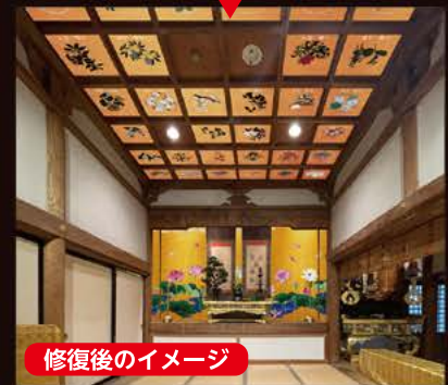
修復後のイメージ